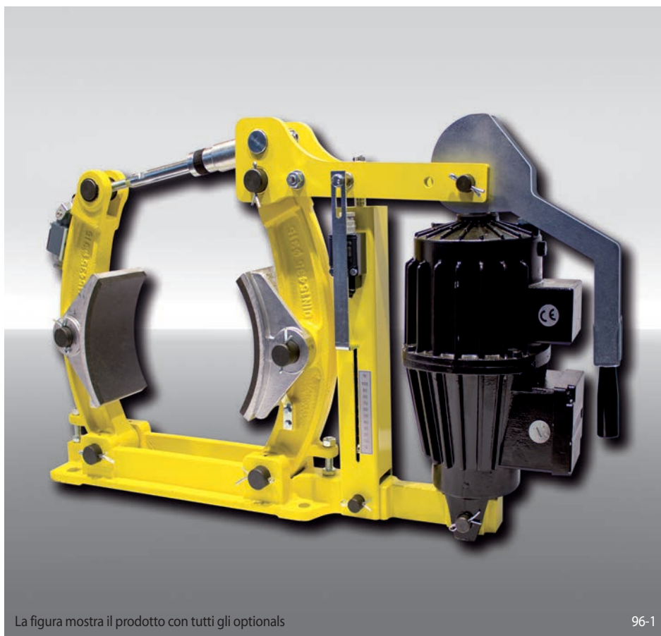
La figura mostra il prodotto con tutti gli optional